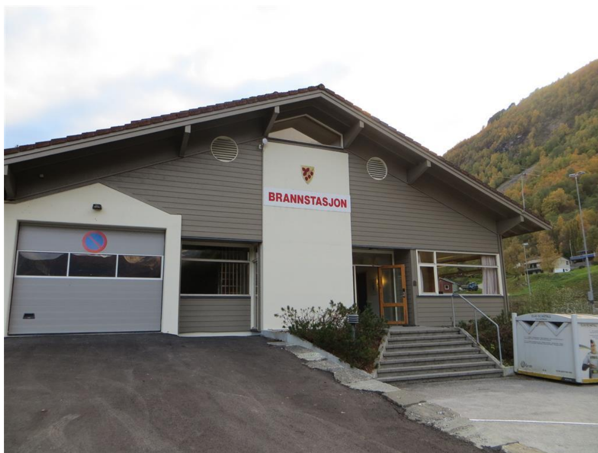
Eidsdal brannstasjon opna i oktober 2015.

Ny brannstasjon på Kalvegjerdet i Eidsdal vart opna 12. oktober. Den gamle stasjonen i Kleivafabrikken i Eidsdal sentrum vart samstundes tatt ut av bruk og bygget er no seld. Eidsdal og Norddal har dermed fått ein godt utstyrt og vel fungerande brannstasjon trygt plassert i høve til eventuell flodbølge frå fjellskred.