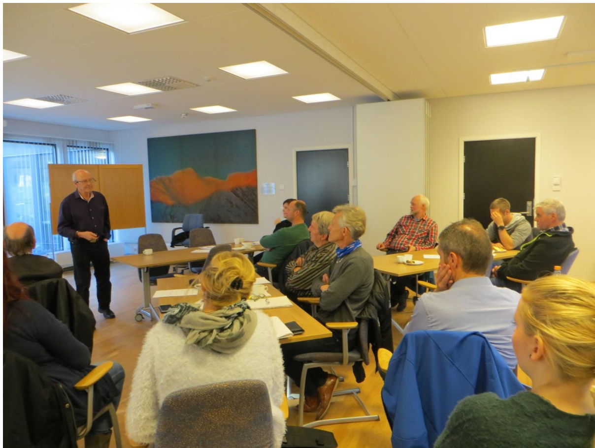
Frå opplæring av folkevalde etter kommunevalet 2015.