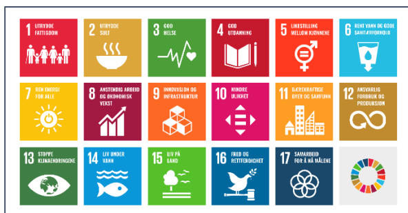
Figur 2. FNs bærekraftsmål er verdens felles arbeidsplan fordelt over 17 målområder for å utrydde fattigdom, bekjempe ulikhet og stoppe klimaendringene innen 2030.

Regjeringen har bestemt at FNs 17 bærekraftsmål, som Norge har sluttet seg til, skal være det politiske hovedsporet for å ta tak i vår tids største utfordringer, også i Norge. Det er derfor viktig at bærekraftmålene blir en del av grunnlaget for samfunns- og arealplanleggingen. Våren 2020 ble det klart at regjeringen skal lage en nasjonal handlingsplan for målene. Dette er viktig fordi de 17 bærekraftmålene henger tett sammen. Det er også nødvendig med en god plan for hvordan målene kan oppnås på tvers av politiske skillelinjer og i samarbeid med organisasjoner og kommuner.