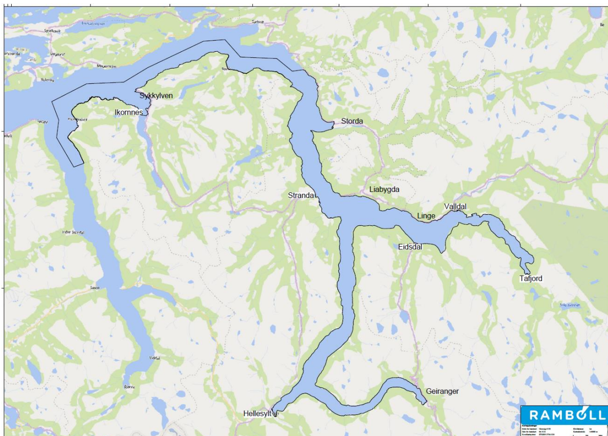
Figur 3. Planområdet for felles sjøarealplan for Fjord, Stranda og Sykkylven kommune

Se kart over planområdet i figuren under.